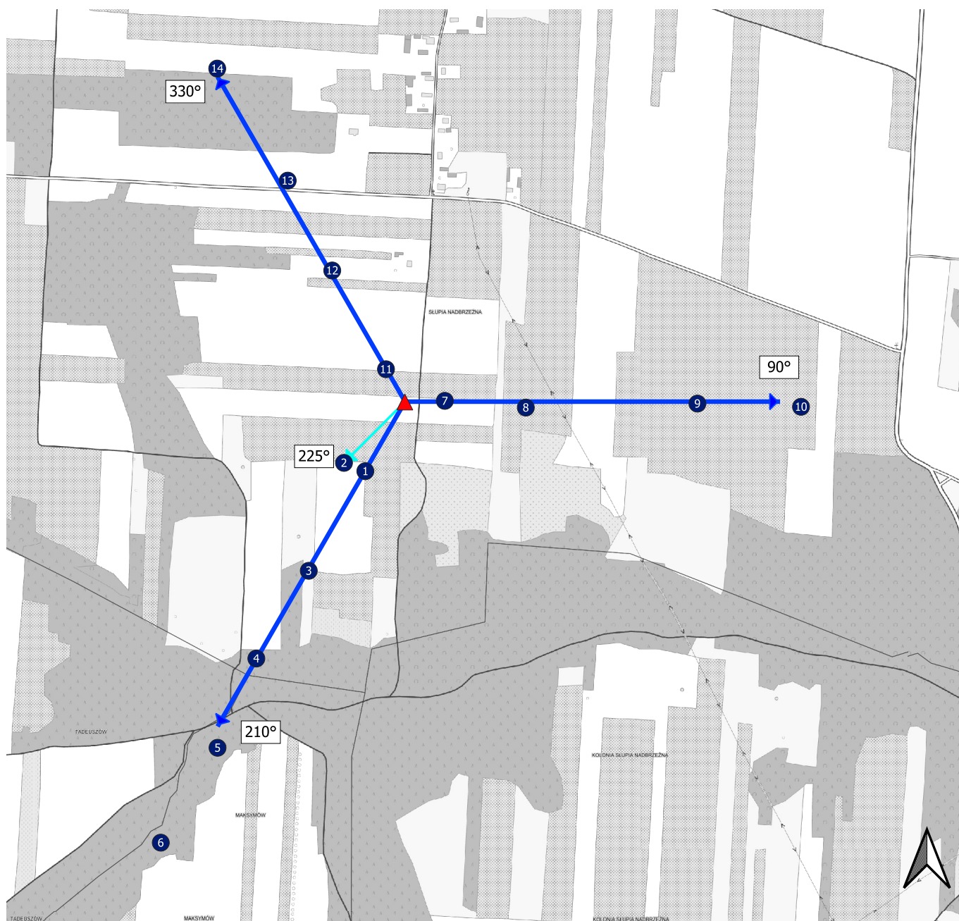
Załącznik 2. Widok pionów pomiarowych