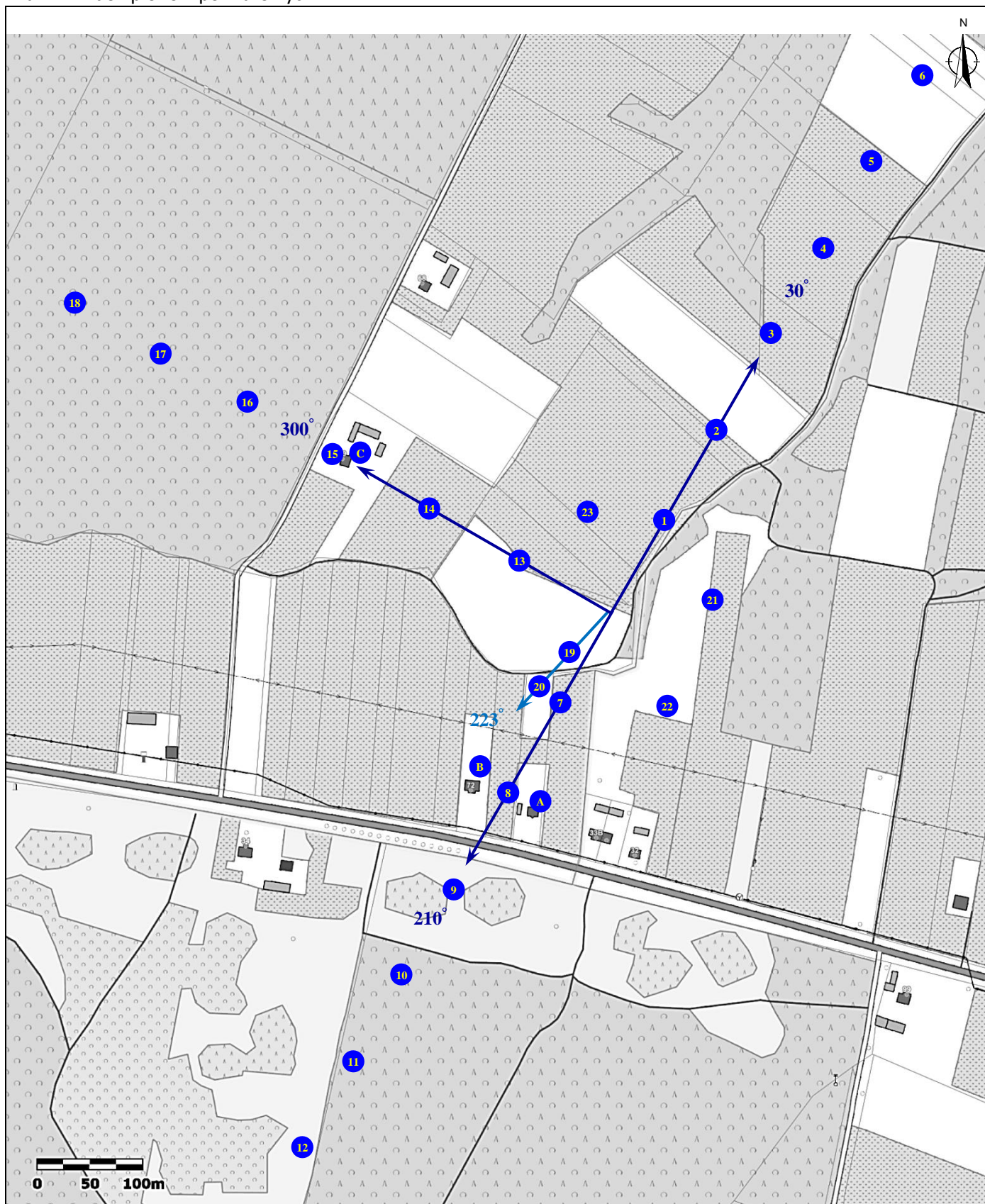
Załącznik 2. Widok pionów pomiarowych